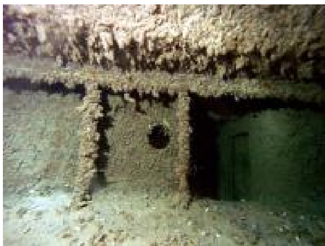
Помещения на баке

20 августа 1943 г. конвой «Hermelin» в составе транспорта «Варна» в охране румынских эсми