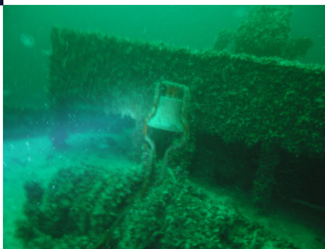
Рында на заднем плане сразу за дайверами.