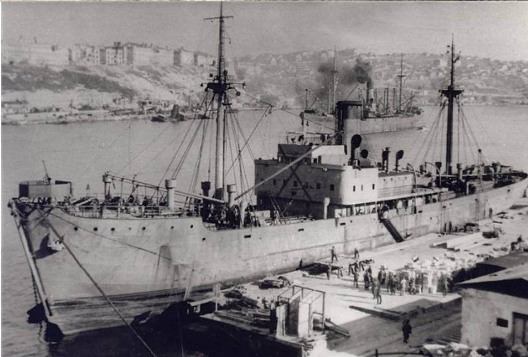
Болгарский транспорт. Спущен на воду в 1937 г. Вместимость: 2143 брт.