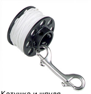
Катушка и шпуля.